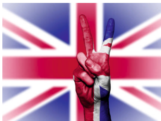
MODULO FORMATIVO "English is my future"

Destinatari: classi seconde e terze sezioni A/D scuola secondaria di