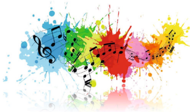
MODULO FORMATIVO "Beat and creativity at school"

Destinatari: classi prime e seconde sezioni A/D scuola secondaria di