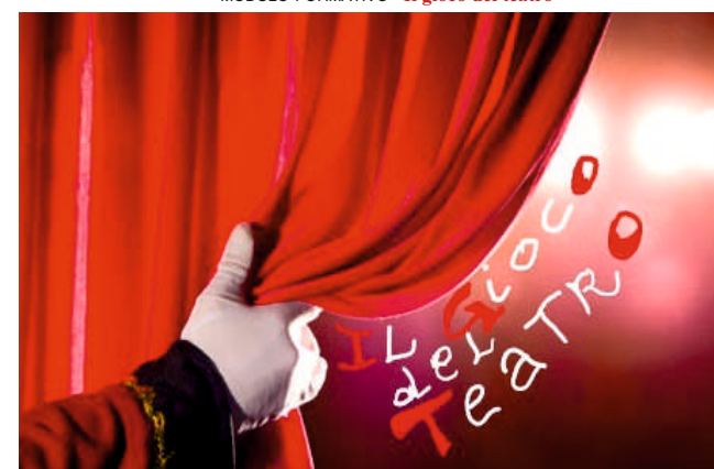
MODULO FORMATIVO "Il gioco del teatro"

Destinatari: classi prime e seconde sezioni A/D scuola secondaria di