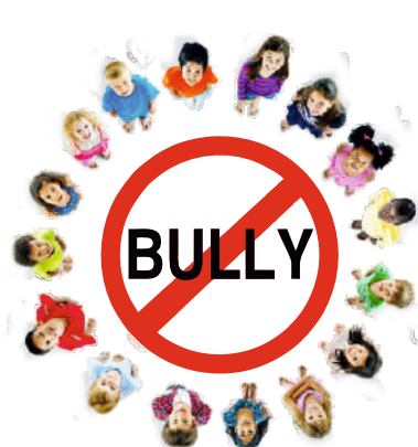
MODULO FORMATIVO "Against the bully"

Destinatari: classi quarte sezioni A/B scuola primaria