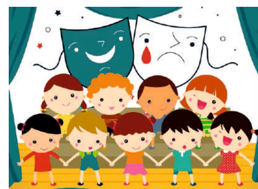
MODULO FORMATIVO "Tutti insieme sul palco"

Destinatari: classi seconde sezioni A/B scuola primaria